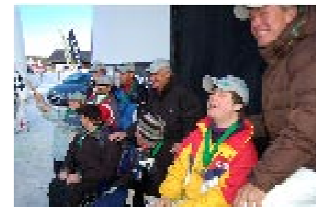
L'équipe gagnante paralympique en compagnie de Patrick Tambay et Craig Pollock