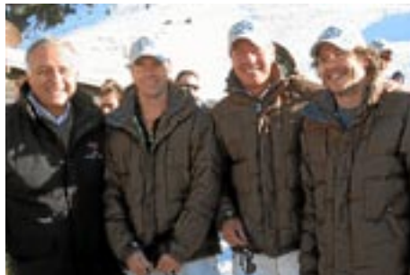
Patrick Tambay, Paul Stewart, Craig Pollock et Jacques Villeneuve